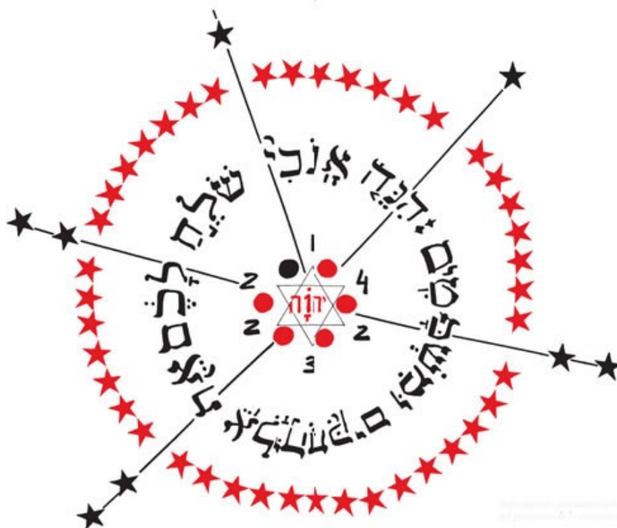
Reproducción (occidentalizada) del pergamino de la «victoria».

Estudio de las estrellas y de los círculos.